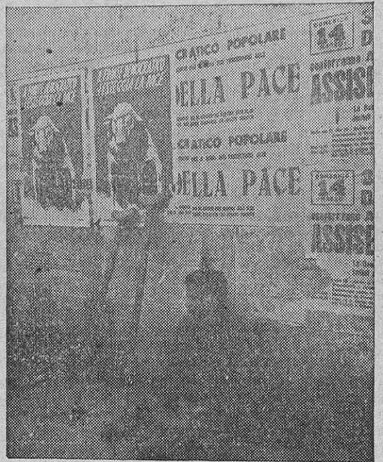
SAN MATEO, SANTIAGO Y LOS SANTOS APOSTOLES

producción del nuevo régimen por medio del arma reaccionaria de la huelga, será severamente reprimida.