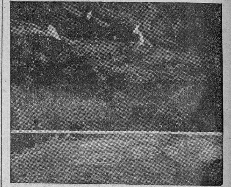
Fotografías del lugar del hallazgo en las cuales, y para dar una más exacta visión, se han reforzado con trazos de yeso las inscripciones prehistóricas.

Fuera de España, y ya desde el año 1864 se conocen en Escocia (PASA A TERCERA PAGINA)